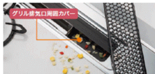
※別途オープンを探窓させる場合はカバーを取り外す必要があります。 ※お客様でカバーを外すことはできません

グリル排気口の周囲に、カバーを採用しました。 野菜くずなどの落ち込みをしっかりガード。 お手入れがしやすくなりました。