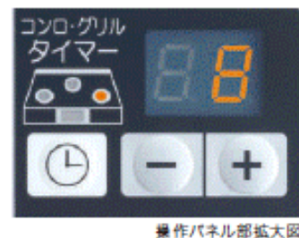
操作パネル部拡大図

コンロは3カ所から1カ所を選択してご使用できます。 (タイマー使用箇所を光ってお知らせします。)